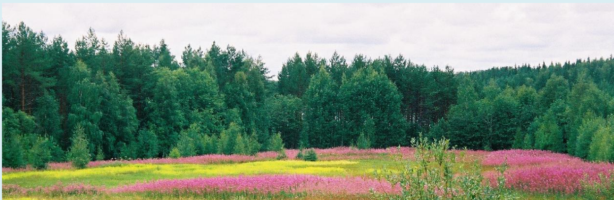
Южное Саво, Финляндия.

Умиротворяющая атмосфера, безопасность, прекрасная природа и здоровая пища делают Финляндию идеальным местом для восстановления физического здоровья и душевных сил.